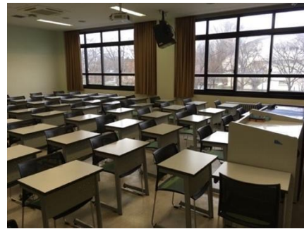
図 1 E 棟 2 階普通教室・E 棟 3 階普通教室ブロック（E206）の内観