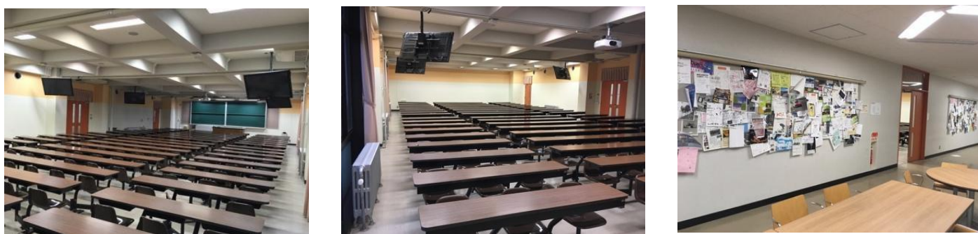
図4 椅子固定教室ブロック その1（E310）の内観及び外観