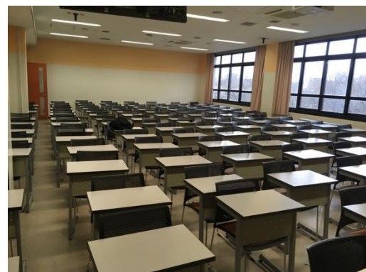
図 2 大教室ブロック（E308）の内観