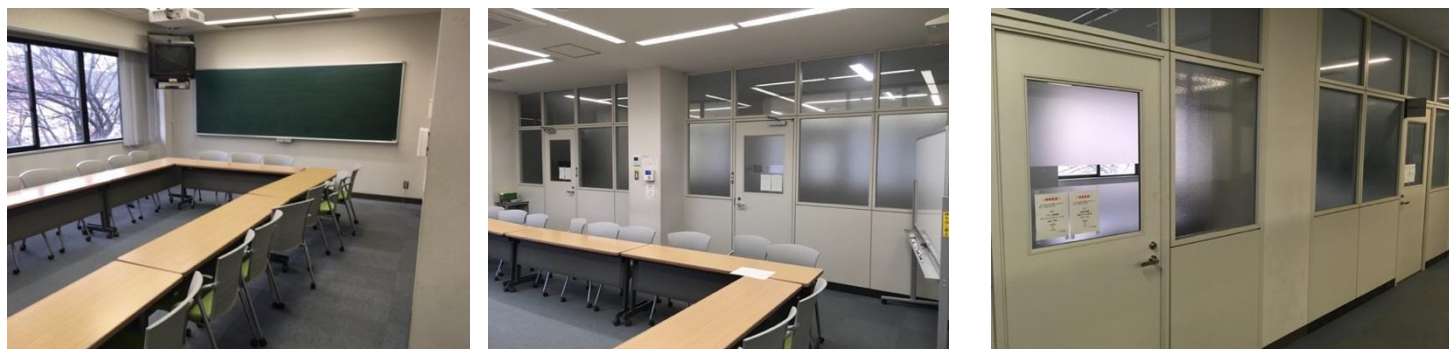
図3 N棟演習室ブロック（N234）の内観及び外観