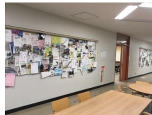
図 4 椅子固定教室ブロック その1(E310)の内観及び外観