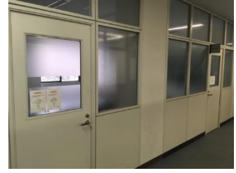
図3 N棟演習室ブロック(N234)の内観及び外観