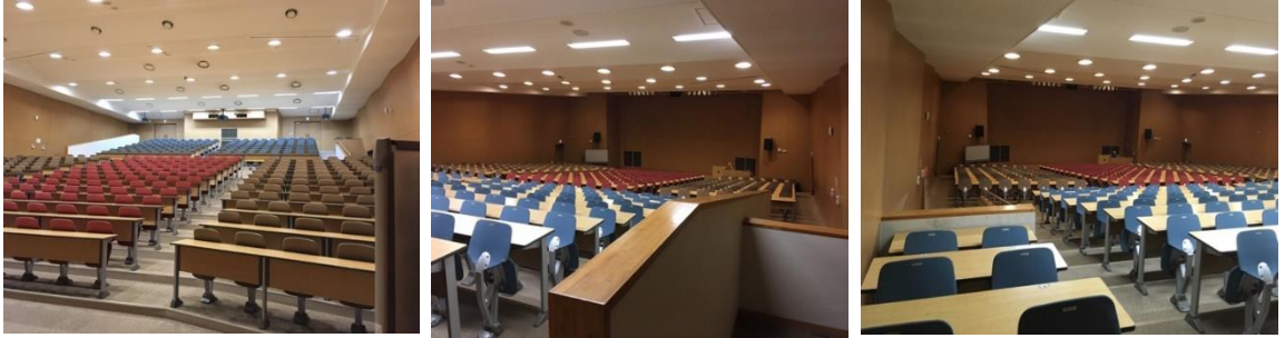
図5 椅子固定教室ブロック その2(大講堂)の内観