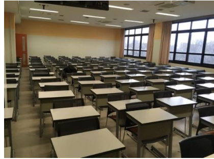
図2 大教室ブロック(E308)の内観